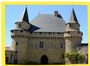
*Classé Monument Historique.

Construit au XV ème siècle sur une ancienne motte féodale, son enceinte fortifiée comportait 9 trous dont certaine rasées ; elle était entourée de douves. Le donjon est constitué d'un châtelet quadrangulaire et de deux tours. Il est également ceinturé par un chemin de ronde sur mâchicoulis.