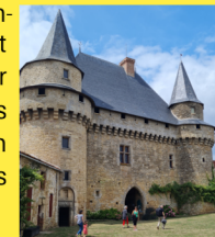
Classé Monument Historique

Construit au XV ème siècle sur une ancienne motte féodale, son enceinte fortifiée comportait 9 tours, dont certaines ont été rasées. Le donjon est constitué d'un châtelet quadrangulaire et de deux tours. Il est également ceinturé par un chemin de ronde sur mâchicoulis. Deux pont-levis donnaient accès au château qui fut en partie détruit par un incendie en 1793, suite au passage des colonnes infernales.