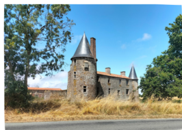
Propriété privée, aucune visite possible

Le château actuel date du XV ème siècle. Il a été édifié au centre d'un triangle où siégeaient de puissantes forteresses (Les Essarts, la Chaize le Vicomte et Bournezeau). Le château servait alors de relais entre ces points forts. De nombreux vestiges témoignent encore aujourd'hui de cette position : des tours de défense avec bretèches et archères canonnières.