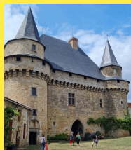
Classé Monument Historique

Construit au XV ème siècle sur une ancienne motte féodale, son enceinte fortifiée comportait 9 tours, dont certaines ont été rasées. Le donjon est constitué d'un châtelet quadrangulaire et de deux tours. Il est également ceinturé par un chemin de ronde sur mâchicoulis. Deux pont-levis donnaient accès au château qui fut en partie détruit par un incendie en 1793, suite au passage des colonnes infernales.