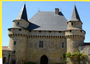
Classé Monument Historique.

Deux pont-levis donnaient accès au château qui fut en partie détruit par un incendie en 1793, suite au passage des colonnes infernales.