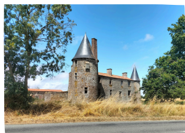
Propriété privée, aucune visite possible

Le château actuel date du XV ème siècle. Il a été édifié au centre d'un triangle où siégeaient de puissantes forteresses (Les Essarts, la Chaize le Vicomte et Bournezeau). Le château