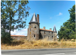
Propriété privée, aucune visite possible

Le château actuel date du XV ème siècle. Il a été édifié au centre d'un triangle où siégeaient de puissantes forteresses (Les Essarts, la Chaize le Vicomte et Bournezeau). Le château servait alors de relais entre ces points forts. De nombreux vestiges témoignent encore aujourd'hui de cette position : des tours de défense avec bretèches et archères canonnières.